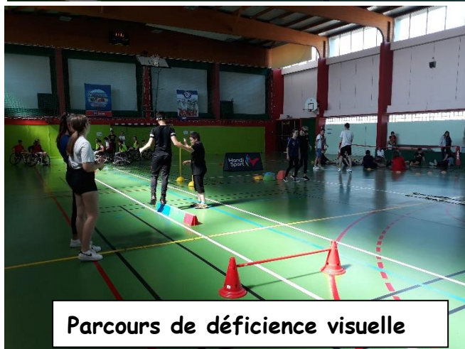
Parcours de déficience visuelle