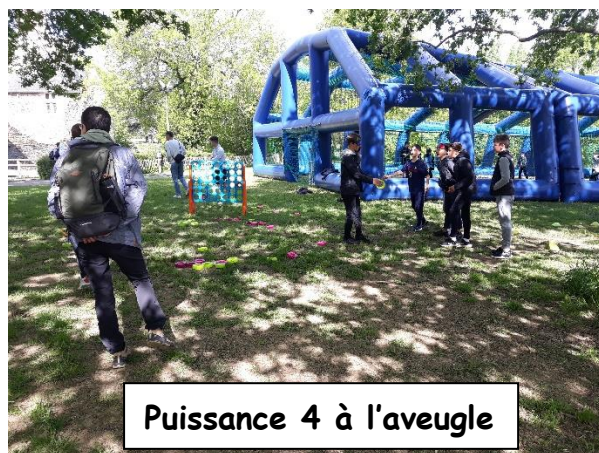
Puissance 4 à l'aveugle