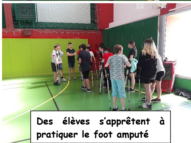
Des élèves s'apprêtent à pratiquer le foot amputé