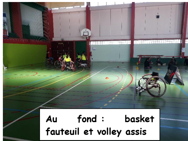
Au fond : basket fauteuil et volley assis