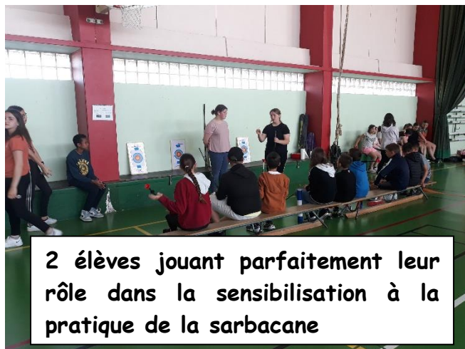
2 élèves jouant parfaitement leur rôle dans la sensibilisation à la pratique de la sarbacane

Le mardi 6 juin, les deux classes ayant participé au projet ont encadré les Olympiades du collège en faisant vivre la même expérience aux classes de 6è A, 6è B, 6è C et 5è A. Ainsi, plus de 150 élèves auront pu expérimenter la pratique du handisport.